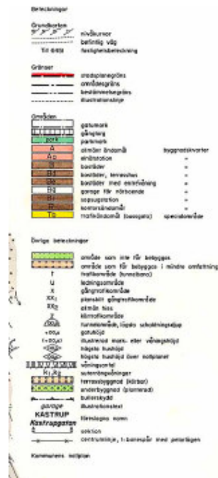
Plankarta över brf Samsö, Lantmäteriet Stockholm http://planer.sbk.stockholm.se/SBKPlanTemplates/SBKVPlanSearchMap